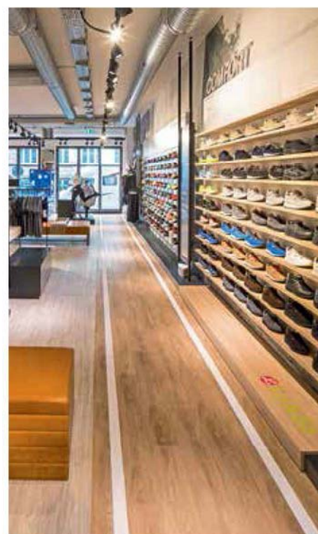
Der Laufbereich ist Teil des Wegeleitsystems und führt Kunden in den hinteren Ladenteil.